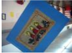
San Andrés y Sta Magdalena Dos Torres (Córdoba)