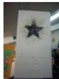
Residencia de Mayores de Archidona Archidona (Málaga)