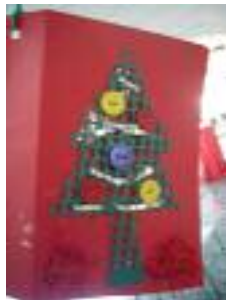
Residencia para Mayores San Pedro Nolasco El Viso del Alcor (Sevilla)