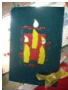
Hospital San Sebastián Palma del Río (Córdoba)