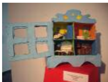
Premio especial a la originalidad "Mi casa en Navidad" Afa La Rambla La Rambla (Córdoba)