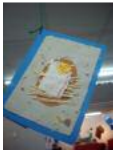
Centro Polivalente de Mayores Santa Isabel Huétor-Tájar (Granada)