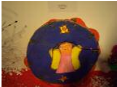
Cruz Blanca Aznalcollar (Sevilla)