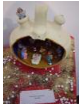
Salusán Geriatria Sevilla