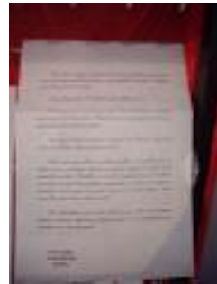
Ave María Lora del Río (Sevilla)