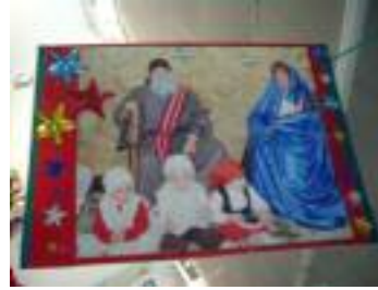
Santísimo Cristo de los Remedios La Rambla (Córdoba)