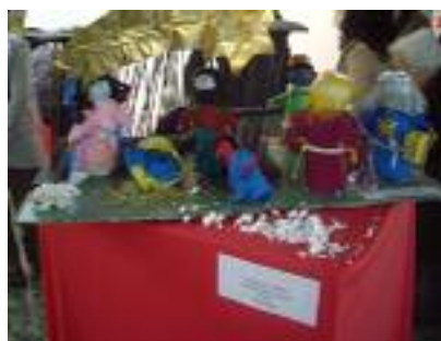
Fundación Gerón Fuente de la Salud Padul (Granada)