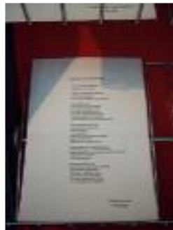
Buenos Aires Granada