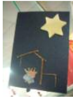
Centro Oasis Granada