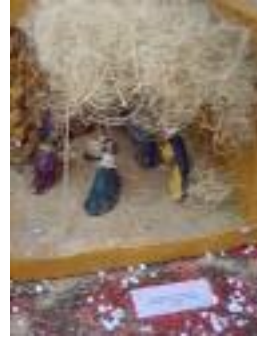
Residencia Municipal El Puerto de Sta María (Cádiz)