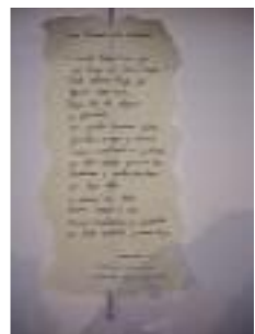
Hospital San Sebastián Palma del Río (Córdoba)