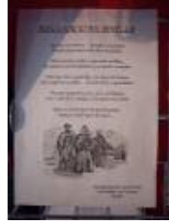
Nuestra Señora de Gracia La Puebla de Cazalla (Sevilla)