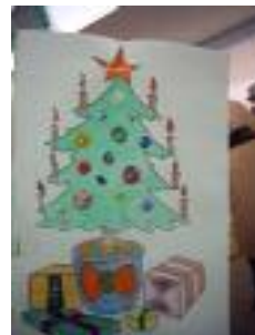
UED Bailén Bailén (Jaén)