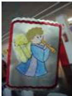
Residencia de Mayores Ciudad de Adra Adra (Almería)