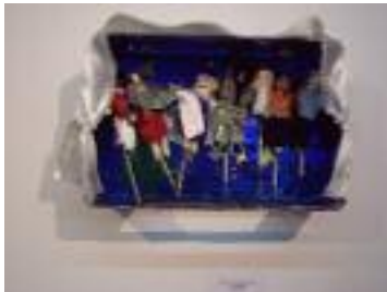
Alcalde Antonio Pulido Almedinilla (Córdoba)