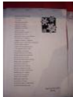
SAR Santa Justa Sevilla