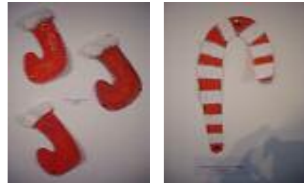
Residencia de Mayores Tristán La Algaba (Sevilla)