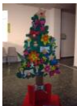
Mejor Manualidad "Árbol de Ilusión" UED La Buhaira Sevilla