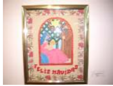
Residencia para mayores de Marchena (Sevilla)