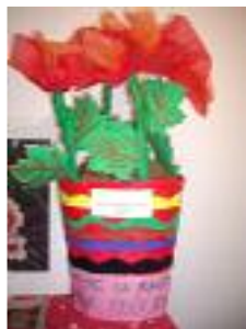
Residencia de Mayores Tristán La Algaba (Sevilla)