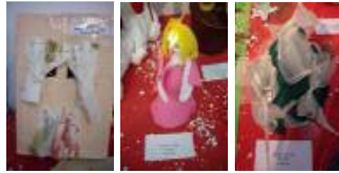
FOAM Guadix Guadix (Granada)