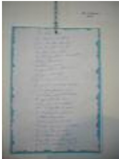
UED La Buhaira Sevilla