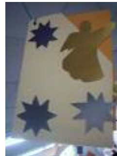
FOAM Peligros Peligros (Granada)