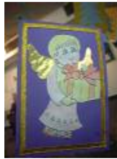
UED Alkama Camas (Sevilla)