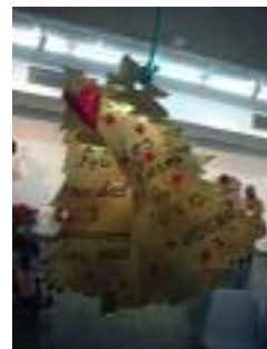
Hogar I Almería