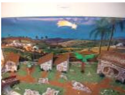
Salusán Geriatria Sevilla