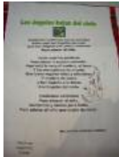
Miramar Algeciras (Cádiz)