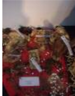
FOAM Guadix Guadix (Granada)