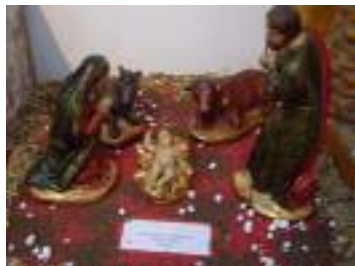
Asociación de jubilados EADS-CASA Sevilla