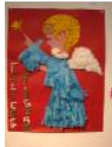
La Milagrosa Sevilla