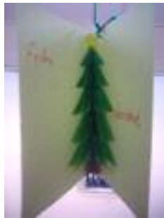
FOAM Jaén Jaén