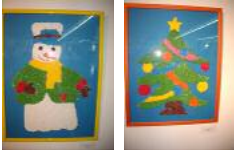
Residencia San Pedro Carmona (Sevilla)