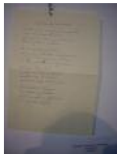
Santísimo Cristo de los Remedios La Rambla (Córdoba)