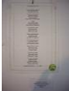
Fundación Gerón Hermana Josefa María Guadalcanal (Sevilla)