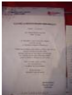
Centro polivalente de mayores Santa Isabel Huétor-Tajar (Granada)