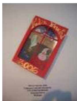
Mejor Tarjeta Navideña "Paisaje de Navidad" SAR Torrequebrada Benalmádena (Málaga)