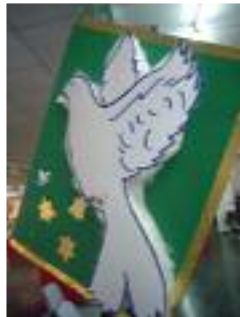
Residencia San Cristóbal Las Gabias (Granada)