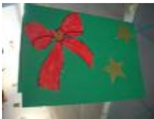
Residencia Asistida de Marchena Marchena (Sevilla)