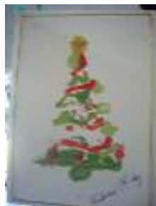
SAR Santa Justa Sevilla