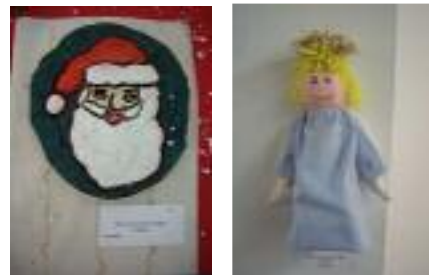
UED Ciudad de El Ejido El Ejido (Almería)