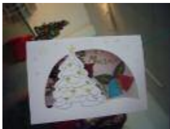
Residencia Virgen de los Dolores Zahara de la Sierra (Cádiz)