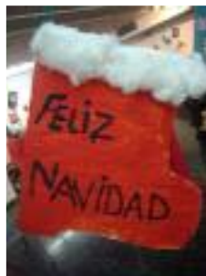
UED Catedi Albolote (Granada)