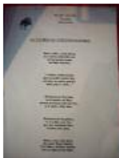
FOAM Guadix Guadix (Granada)