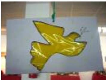
Residencia Municipal de San Roque San Roque (Cádiz)