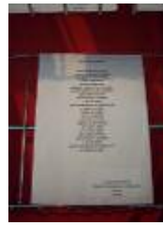
Fundación Gerón Nuestra Señora de la Soledad Tocina (Sevilla)