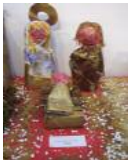
Santa María de Gracia Calañas (Huelva)