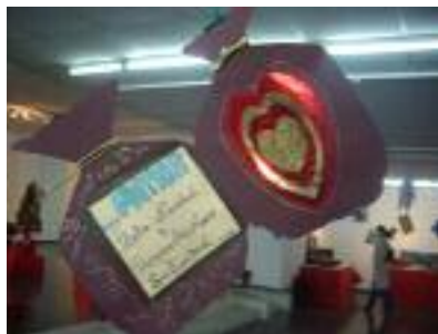
SAR Fuentesol Alhaurín de la Torre (Málaga)