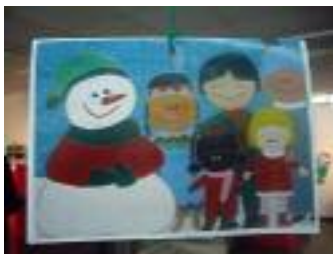
Afa La Línea La Línea de la Concepción (Cádiz)