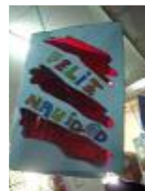
Residencia de Mayores Cruz Blanca Aznalcollar (Sevilla)