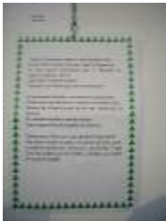
Hogar I Almería