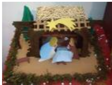
Nuestra Sra de los Remedios Ubrique (Cádiz)