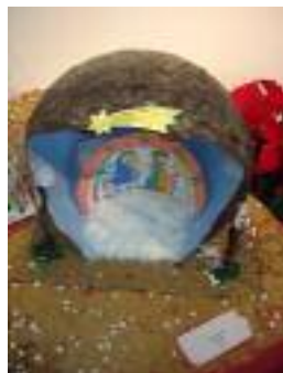
UED Bailén Bailén (Jaén)