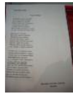
Residencia San Camilo Sevilla