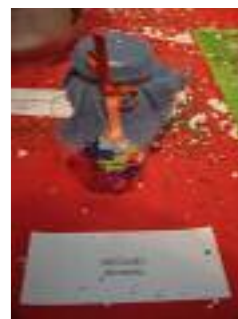
Hogar I Almería