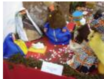
Virgen de los Dolores Zahara de la Sierra (Cádiz)