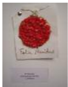
El Mirador Almodóvar del Río (Córdoba)