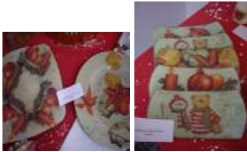
Residencia San Camilo Sevilla