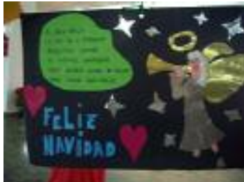
Residencia de Mayores Luz de Magina Cambil (Jaén)