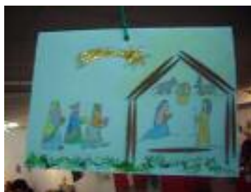
Residencia de Ancianos Cruz Roja Española San Fernando (Cádiz)