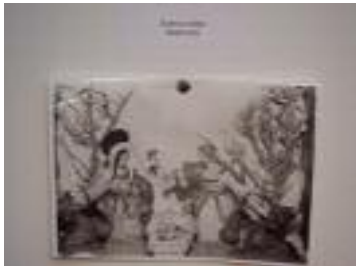
Buenos Aires Granada