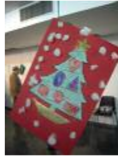
UED Enfermos de Alzheimer Jerez de la Frontera (Cádiz)