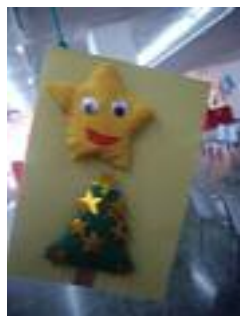
Residencia Alcalde Antonio Pulido Almedinilla (Córdoba)