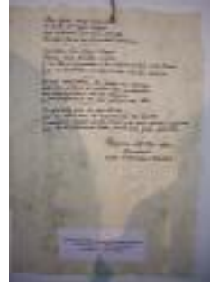
SAR Torrequebrada Benalmádena (Málaga)