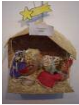
AFA La Rambla La Rambla (Córdoba)