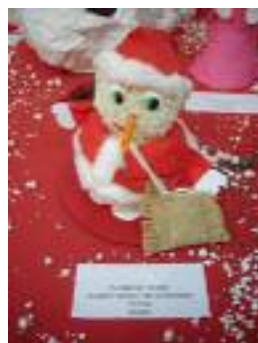
Fundación Gerón Nuestra Señora de la Soledad Tocina (Sevilla)