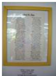
Mejor Poesía "Navidad en familia" Afa La Línea La Línea de la Concepción (Cádiz)