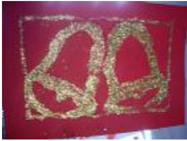
UED El Junquillo La Línea de la Concepción (Cádiz)