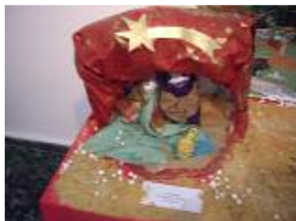
El Mirador Almodóvar del Río (Córdoba)