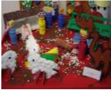
UED Guadalquivir Sevilla