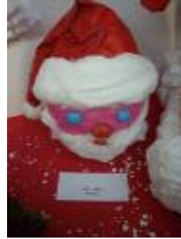
UED Vera Vera (Almería)