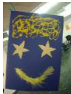
Fundación Gerón Fuente-Tojar Córdoba