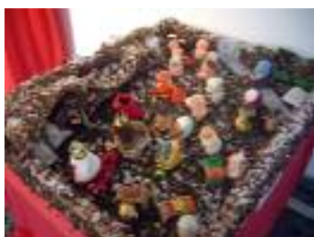
Mejor Nacimiento "Pa' que el niño no tenga frío" UED La Miniera Dos Hermanas (Sevilla)