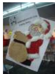
Fundación Gerón Fuente de la Salud Padul (Granada)