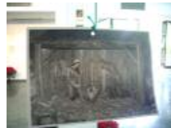
Buenos Aires Granada