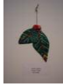
Centro polivalente de mayores Santa Isabel Huétor-Tajar (Granada)