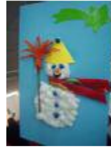
Fundación Gerón Nuestra Señora del Rosario El Cuervo (Sevilla)