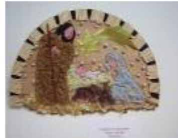
Hospital San Sebastián Palma del Río (Córdoba)