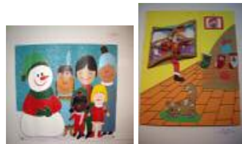
AFA La Línea La Línea de la Concepción (Cádiz)