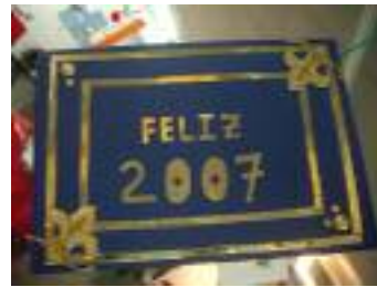
UED Cuevas del Almanzora (Almería)