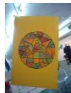
Residencia de Mayores Ave María Lora del Río (Sevilla)