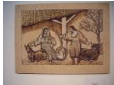
Buenos Aires Granada