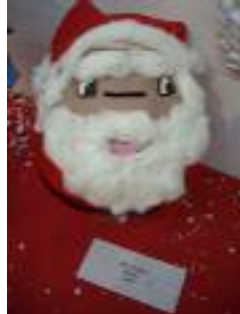
UED Bailén Bailén (Jaén)