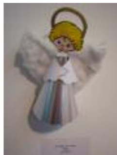
Ciudad de Adra Adra (Almería)