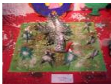
San Cristóbal Las Gubias (Granada)