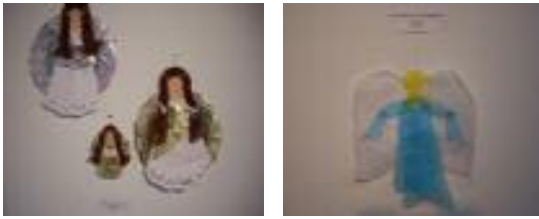
San Andrés y Santa Magdalena Dos Torres (Córdoba)