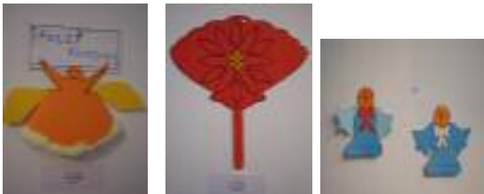
Ave María Lora del Río (Sevilla)