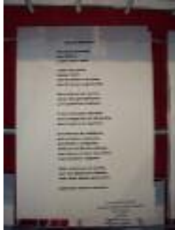
Fundación Gerón Nuestra Señora del Rosario El Cuervo (Sevilla)