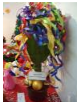
Fundación Gerón Fuente Tojar (Córdoba)