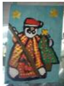
UED Rocío Sánchez Huelva