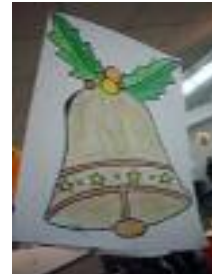
AFA La Rambla La Rambla (Córdoba)