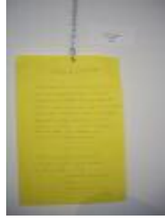
Luz de Magina Cambil (Jaén)