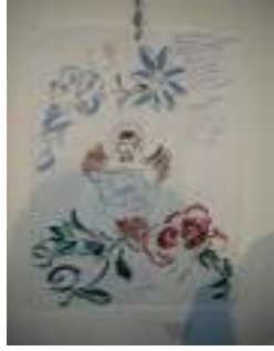
Cruz Blanca Aznaalcollar (Sevilla)