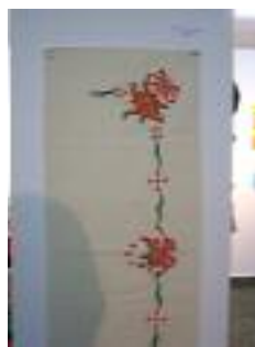
Asociación de Jubilados EADS-CASA Sevilla