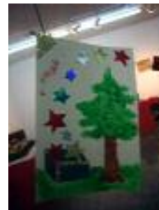
Centro para Mayores María de la Paz Nerva (Huelva)