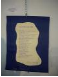
Sar Fuentesol Alhaurín de la Torre (Málaga)