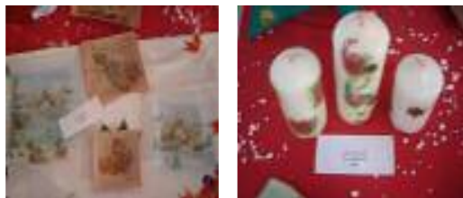
Los Olivares La Carolina (Jaén)