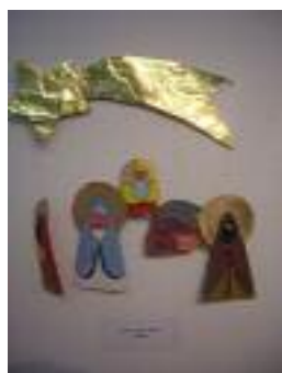
SAR Santa Justa Sevilla