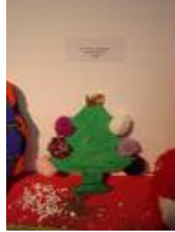
Cruz Roja Española San Fernando (Cádiz)