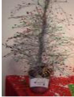
Centro de día Palmones Los Barrios (Cádiz)