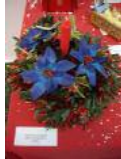
Virgen de los Dolores Zahara de la Sierra (Cádiz)