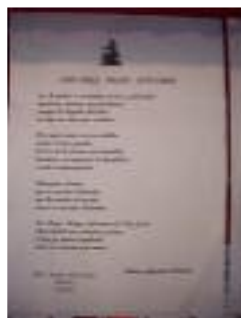
REIF María de la Paz Nerva (Huelva)