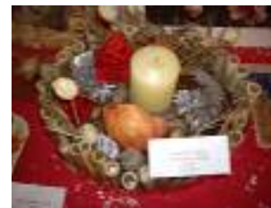
Fundación Gerón Fuente de la Salud Padul (Granada)