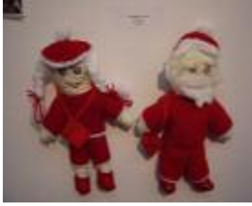
Madre de Dios Almonte (Huelva)