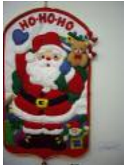
La Roda de Andalucía (Sevilla)