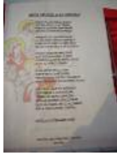
Centro de Mayores Torneo Sevilla