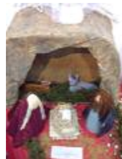
El Junquillo La Línea de la Concepción (Cádiz)