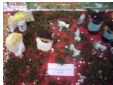
San Andrés y Santa Magdalena Dos Torres (Córdoba)