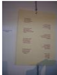
UED Rocío Sánchez Huelva