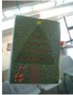
Clece El Puerto de Santa María (Cádiz)