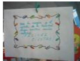
Los Olivares La Carolina (Jaén)