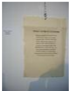
FOAM Peligros Peligros (Granada)