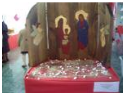
SAR Torrequebrada Benalmádena (Málaga)