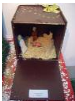
Fundación Gerón Fuente Tojar (Córdoba)