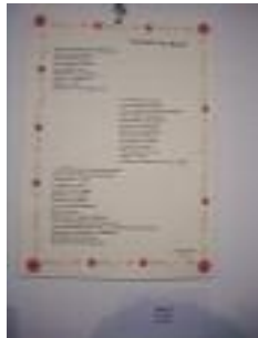
Alkama Camas (Sevilla)