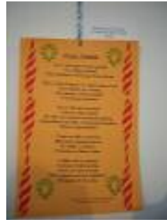
Residencia Municipal El Puerto de Sta María (Cádiz)