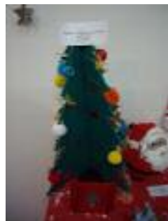
Santísimo Cristo de los Remedios La Rambla (Córdoba)