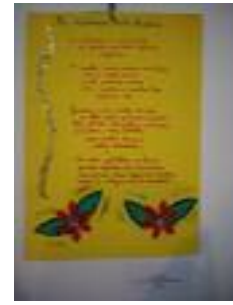
El Junquillo La Línea de la Concepción (Cádiz)