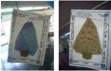
FOAM Guadix Guadix (Granada)