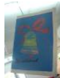
Ciudad de El Ejido El Ejido (Almería)